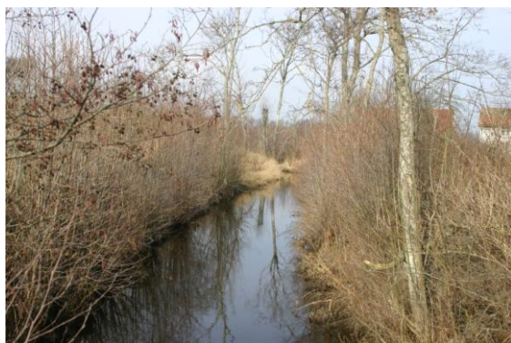
Grisbäcken, vy mot norr från bron i Grisbäck

Nu vill Södra Kärrs Samfällighetsförening hårdtsatsa på att komma tillrätta med den bedrövliga situationen i Grisbäckens mynningsområde i Södra Kärr, i viken mellan fastlandet och Nötholmen. Grisbäcken tömmer här sina föroreningar på sin färd från källa till hav. Mycket av den naturliga reningskapaciteten i bäcken har gått förlorad genom att vattendrag rätats och våtmarker dikats ut.