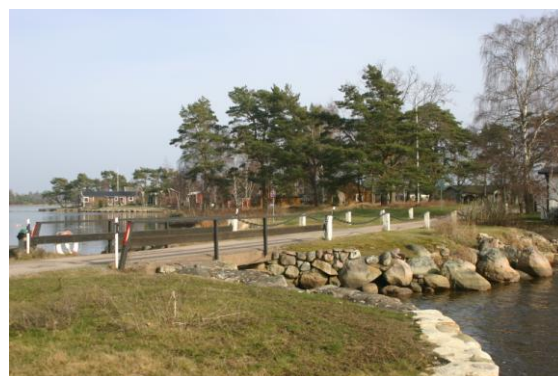
Nuvarande vägbank och bro mellan Södra Kärr och Nötholmen

Bygget av nuvarande vägbank och bro mellan fastlandet och Nötholmen, som skedde på 1940-talet, ströp vattenflödet med ca 90 %. Nu vill föreningen riva vägbanken och den 2½ meter långa bron och ersätta med en 20 meter lång bro. Då kan man återställa vattenflödet som fanns på 1940-talet, innan vägbanken med kort bro ströp flödet.