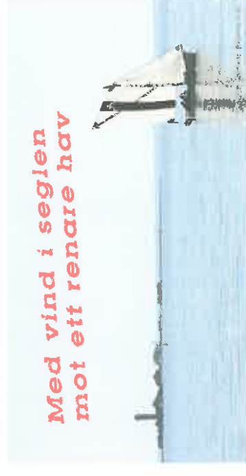
Bild: Garpens fyr i södra Kalmarsund