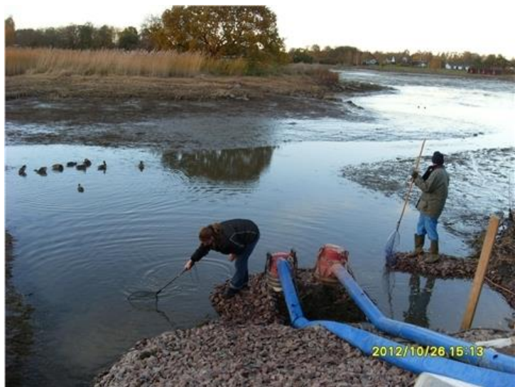
Bilden är tagen hösten 2012, då Ängaskären tömtes på vatten för att förbereda och möjliggöra slamsugning av botten .

Bakgrunden är att de ideella föreningarna i Bergkvara har samverkat för att utarbeta en plan för framtiden. Idéerna har sammanställts i Vision Bergkvara. Syftet med Vision Bergkvara är att ta tillvara och utveckla de möjligheter som finns inom detta unika, natursköna område.