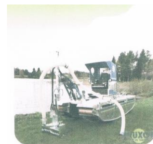
Sedimentpumpning/ muddring av mindre områden