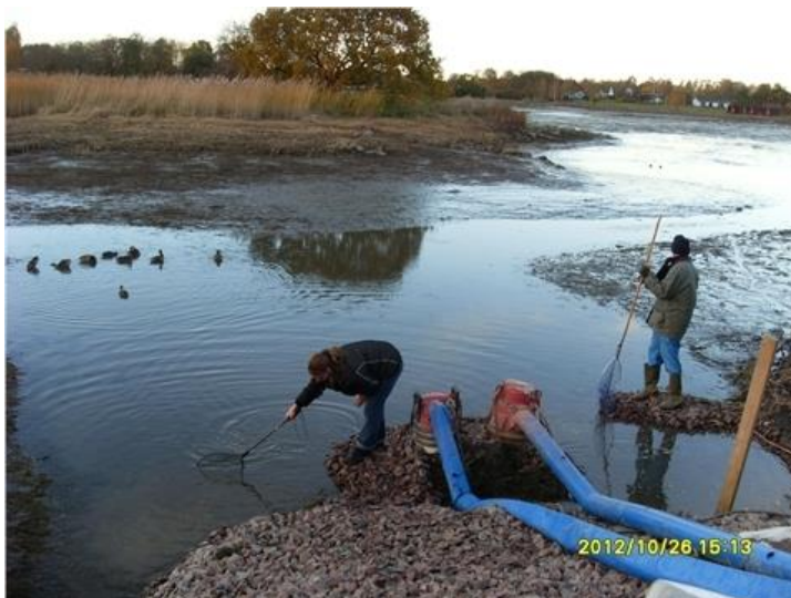
Bilden är tagen hösten 2012, då Ängaskären tömtes på vatten för att förbereda och möjliggöra slamsugning av botten .

Bakgrunden är att de ideella föreningarna i Bergkvara har samverkat för att utarbeta en plan för framtiden. Idéerna har sammanställts i Vision Bergkvara. Syftet med Vision Bergkvara är att ta tillvara och utveckla de möjligheter som finns inom detta unika, natursköna område.