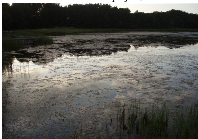
Bilden till höger är tagen sommaren 2011 i den grunda och delvis instängda viken i Södra Kärr.

Projektet har fått namnet ”Genomströmningsprojekt Södra Kärr i samverkan med Torsås kommun i ett helhetstänk för Grisbäckens mynningsområde ur perspektiven reduktion av närsalter, vattenmiljö- och fiskesympunkt i en grund vik av Kalmarsund”!