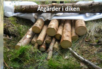
Åtgärder i diken

Att förbättra våra vattenmiljöer kommer också ta lång tid och kräva insatser från flera håll!