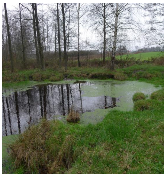
Bild. Delprojekt 08 -Damm med stillastående vatten och vattenförande tillrinnings dike.