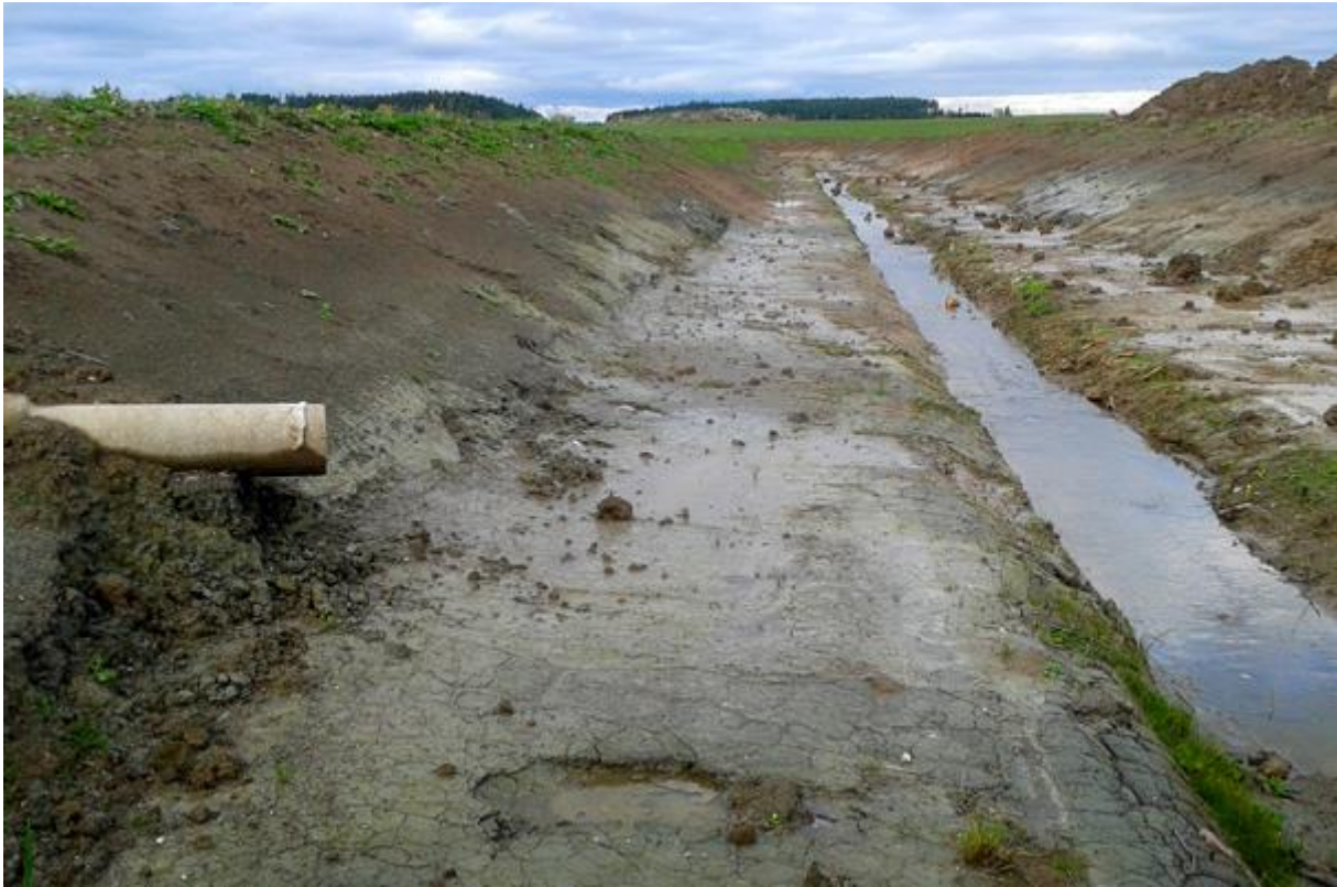
När den smala fåran i mitten inte räcker till rinner vattnet ut på de båda små flacka planen.