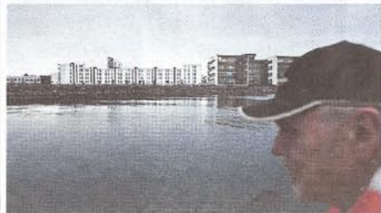
Åltfisket har urgamla traditioner. I Kalmar sker det strax utanför Varvsholmen som fått en helt ny skepnad, långt ifrån Varvstidens storhetsdagar.