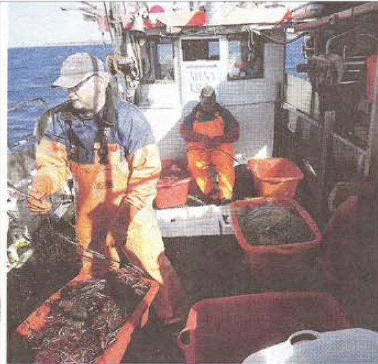
Flundroma trivs utanför Åleklinta, teorin är att det inte blir något näringsläckage där på grund av själva klinten. Säsongs sista fisketur var ändå inte särskilt lyckosam. I första gamet fanns bara tre flundror. Sen blev det bättre men inte bra.