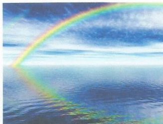
Bild: Regnbåge över södra Kalmarsund

En revision innefattar att genom urval granska system och rutiner samt transaktioner och ekonomiska samband för att skaffa bevis som stödjer de belopp och upplysningar som finns i räkenskapshandlingarna.